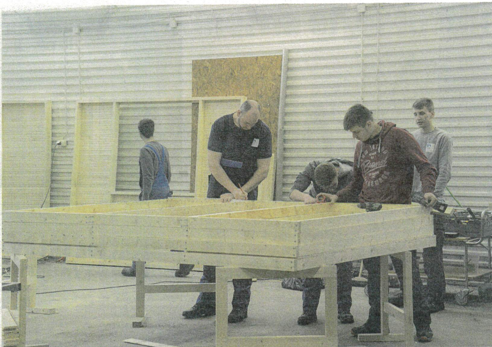
Modulerna till Let's go kids byggs delvis av tyska studenter som en del i deras utbildning.